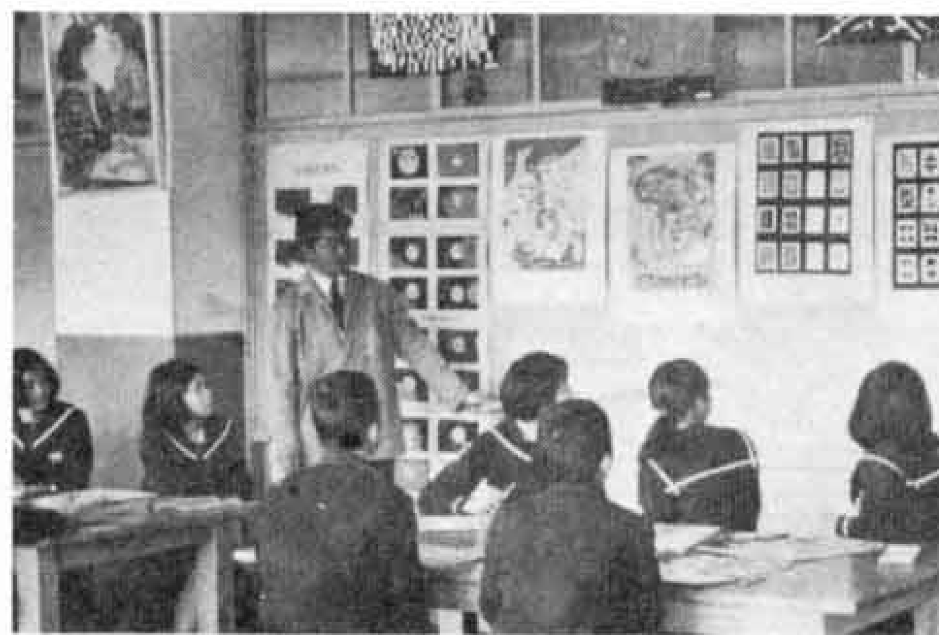
【こんどは文部大臣賞をと熱心に図工の指導をうける生徒たち】