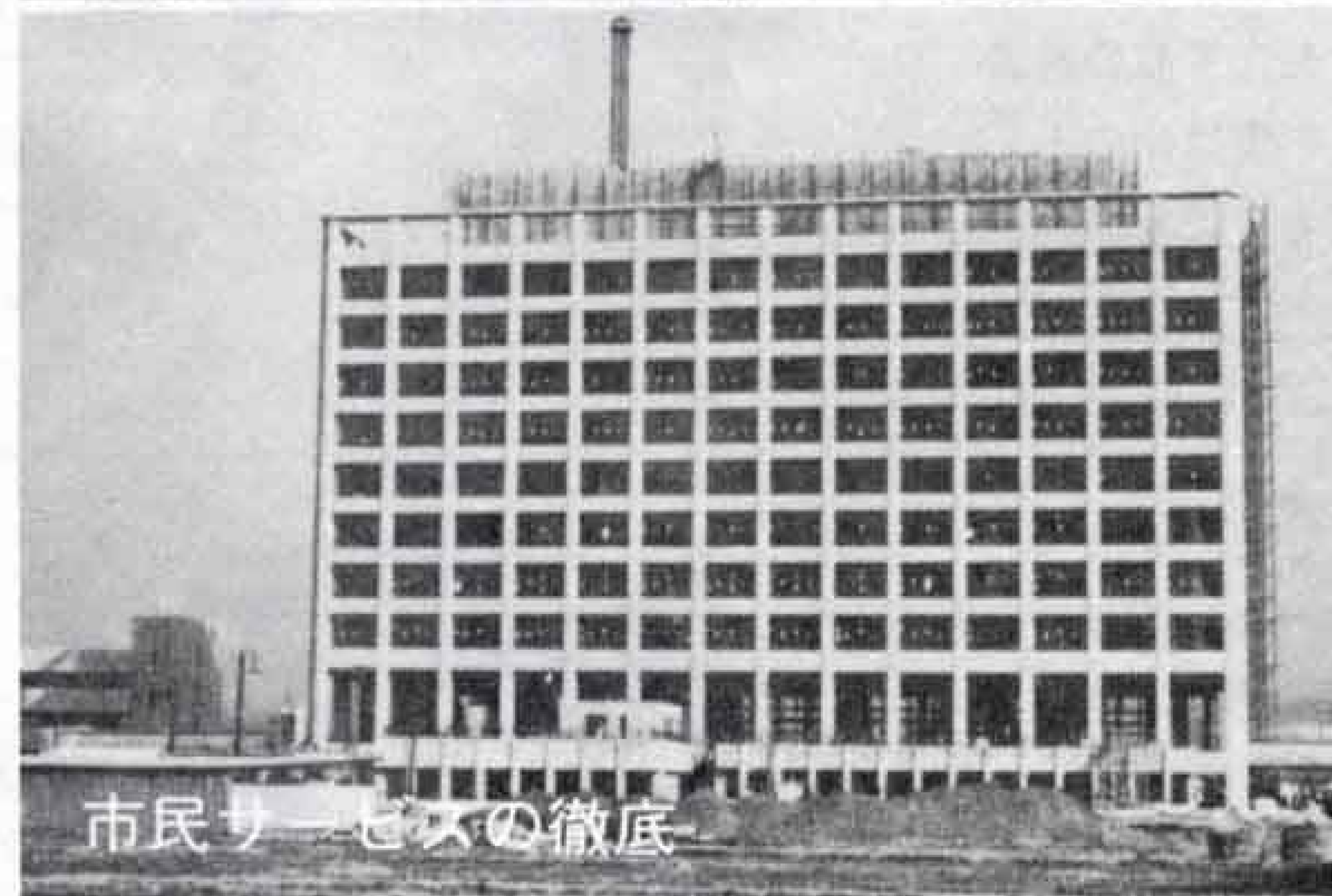
市民サービスの徹底