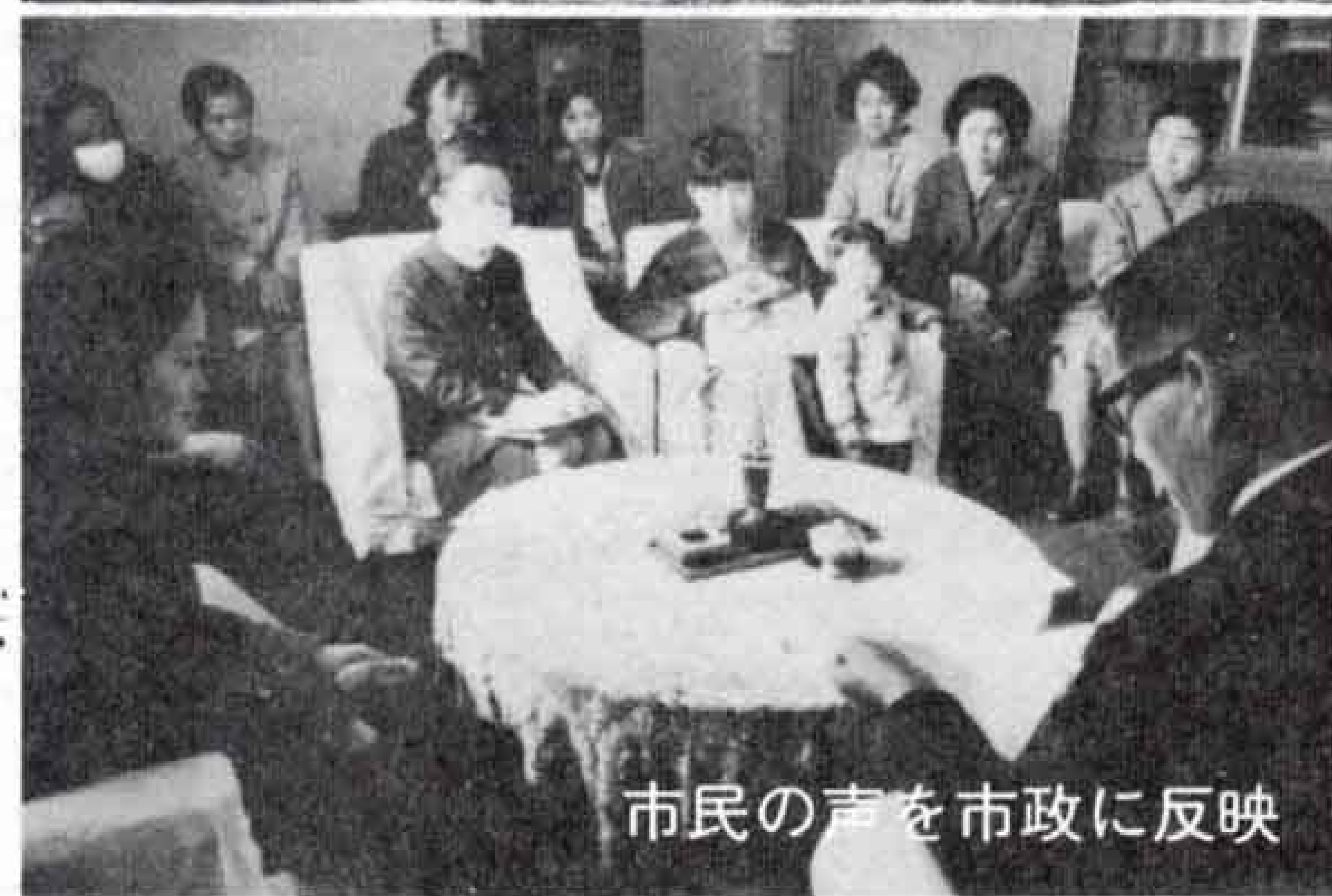
市民の声を市政に反映