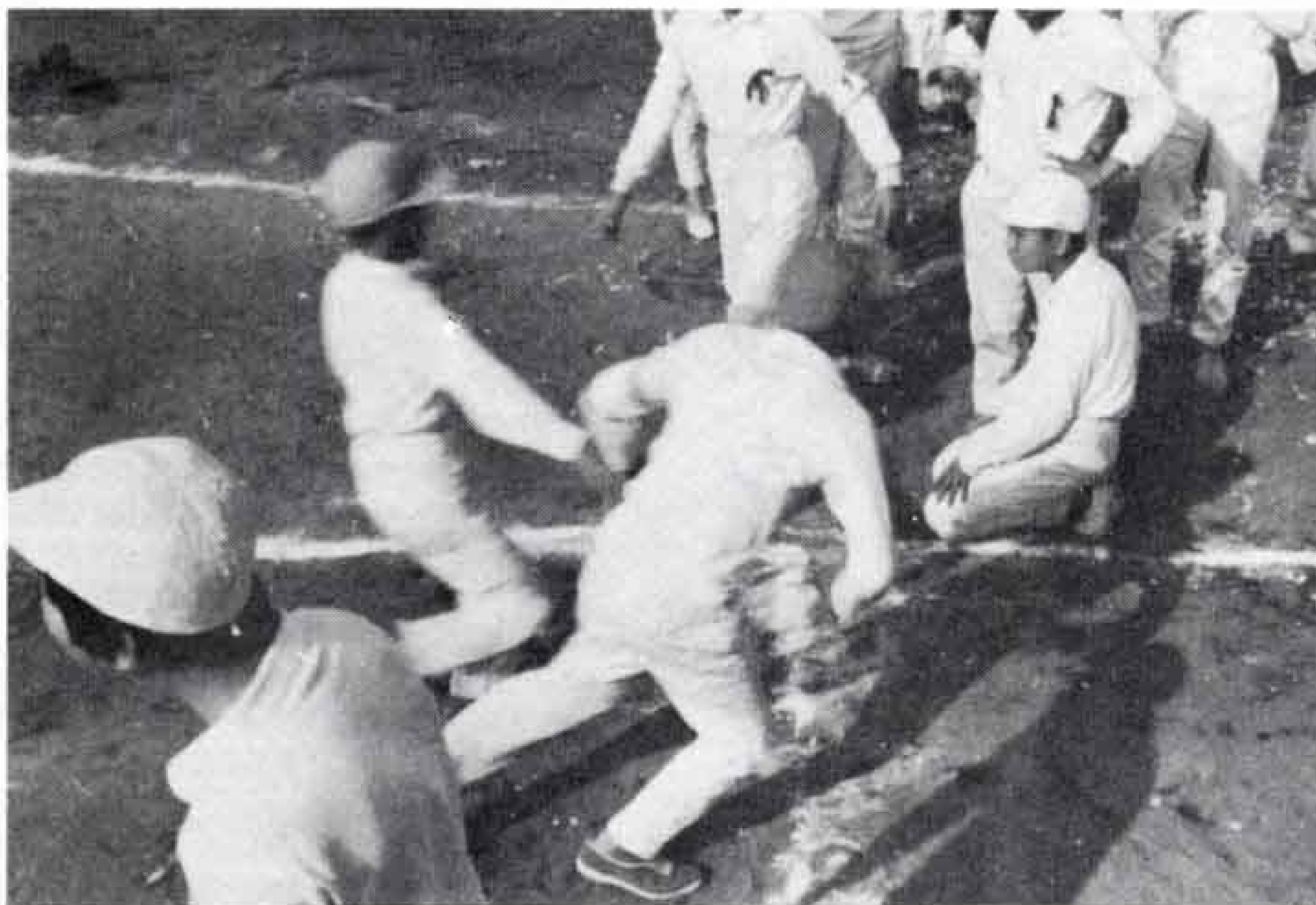
保護者のみなさん、大切なお子さんのために「心身障害者扶養共済制度」に加入されては……。

対象になる心身障害者とは、精神薄弱者、身体障害者手帳をもっている1級から3級までの人などです。