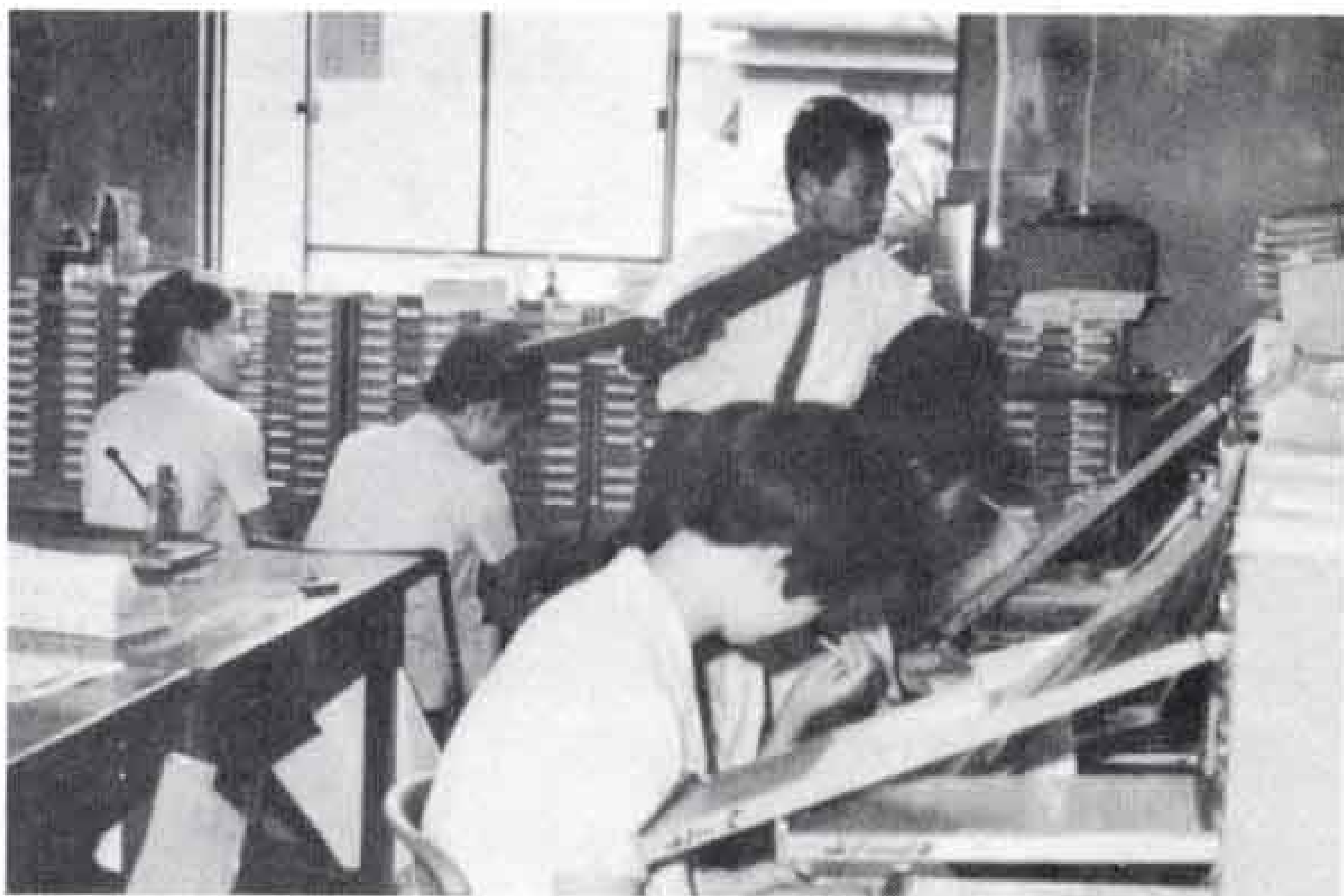
医療費記入に大忙しの保険課職員

険）に加入していない人はすべて加入するように法律で定められています。これがいわゆる「国民皆保険」です。