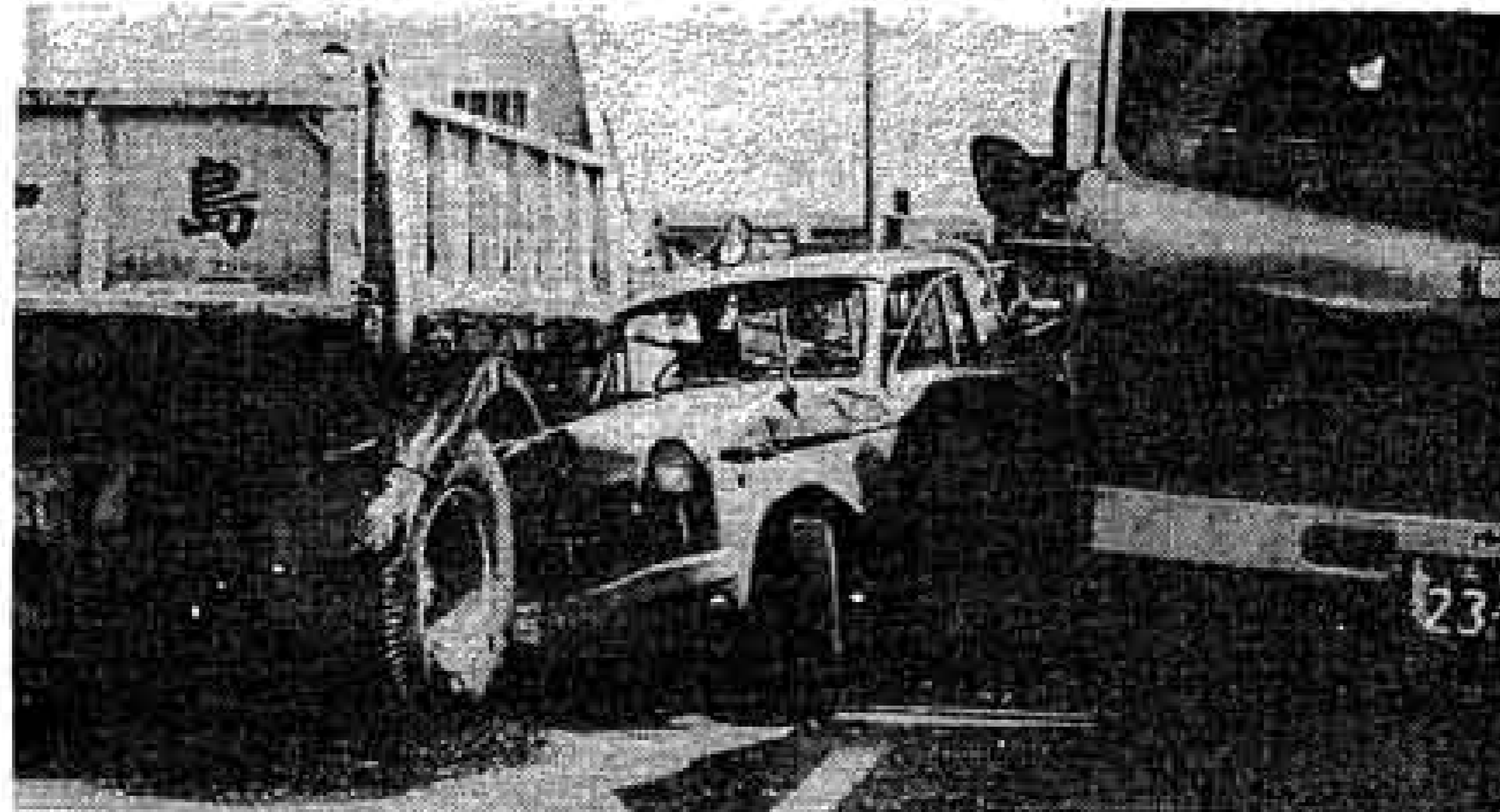
交通事故現場の状況

ちかくしめ、大月線が約十五パーセント、その他が県道、市道となつています。国道一号線では依然田橋交差点で五十二件もの事故が発生し、大昭和裏十字路でも三十六件の事故が発生しており、魔の交差点とも呼ばれています。悲惨な事故を防ぐため児童や幼児が道を歩いているときや、道路を横断しているときは一時停止または徐行する。タバコに火をつけたら