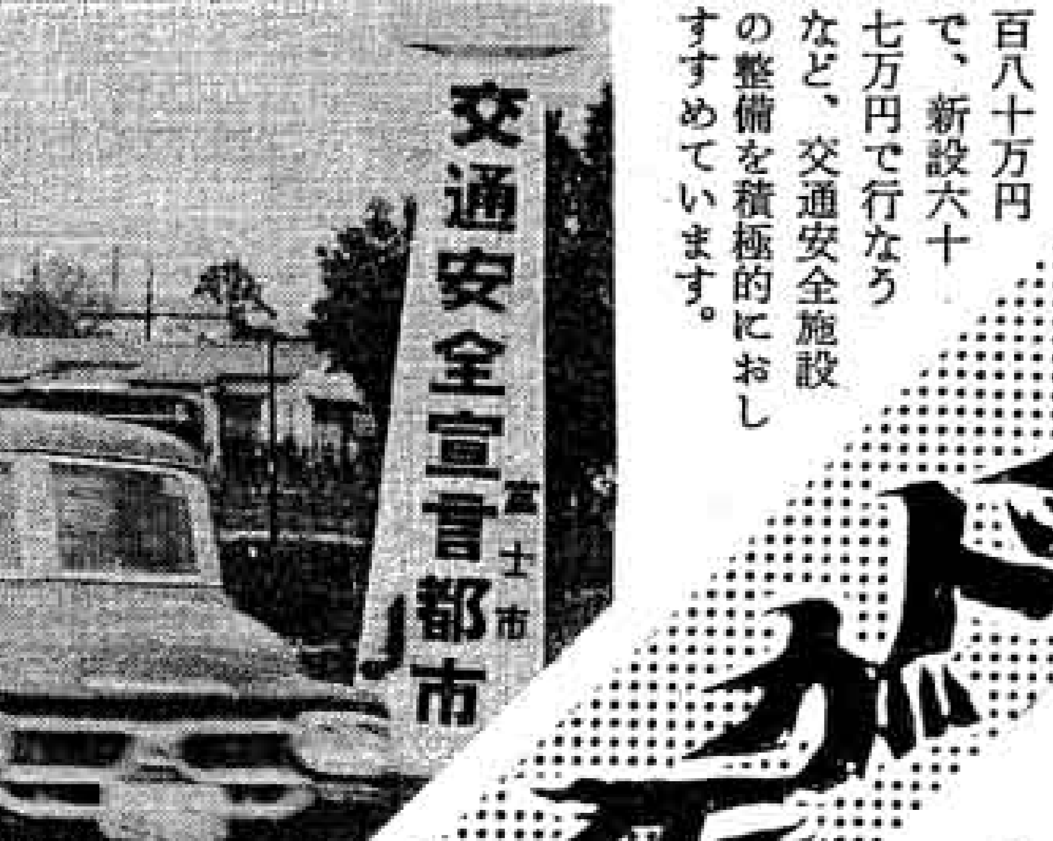
交通安全宣言塔の様子

国道に歩道橋二つ 安全都市宣言塔も 市は、交通安全施設の整備をすすめていますが、このほど横断歩道橋と交通安全都市宣言塔ができました。交通安全都市宣言塔は、大月線沿いの天間南地先根方街道の浮島一地先、国道一号線の橋下地先と元吉原地先の四カ所に建てられました。塔は正三