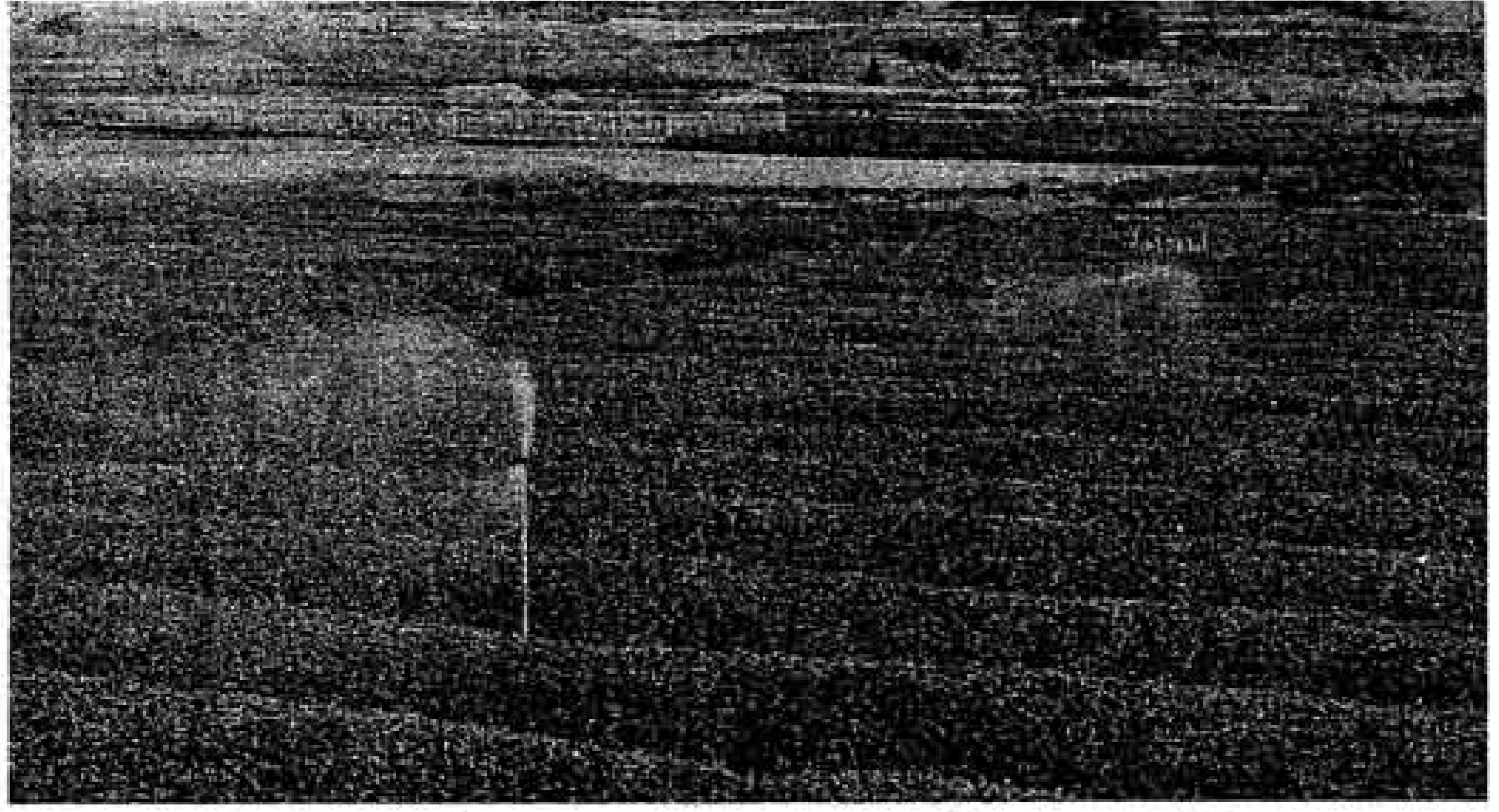
写真はスプリンクラーによるヤブキタ茶のかん水試験。—県茶業試験場で—

大淵、今泉、鷹岡の北部地区は、ヤブキタ茶の普及を進めるとともに、陸播水稲、そ菜類(カンランなど)を中心としています。伝法と鷹岡南部は、さいきんハウス栽培がのびているので、メロン、陸播水稲、陸播などの調査を終り、現在ハウレンソウ、カブなどのそ菜類の調査も進められています。石坂の果茶業試験場ではヤブキタ茶の収量、かんがい施設などの調査が行なわれています。調査の結果は「かんがい」の効果が認められました。くわしい資料は近く発表されます。