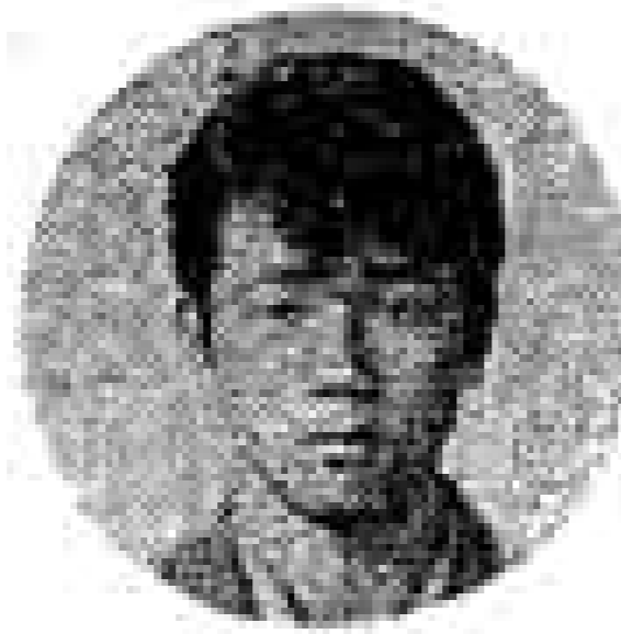
よく世間一般に「いまの若いものは」といいますが、私たちの仲間にはそういう者はひとりもいません。これは「いまの若い者」という言葉のなかに「いま」という言葉がはいる。現在の若者は一貫して自己の個性、あるいは意見や自分の道が決まってい

私は第二期バイオニア大生として昨年一年間、県下各地の仲間と青年活動のリーダーになろうと学びました。そこで得たことを二