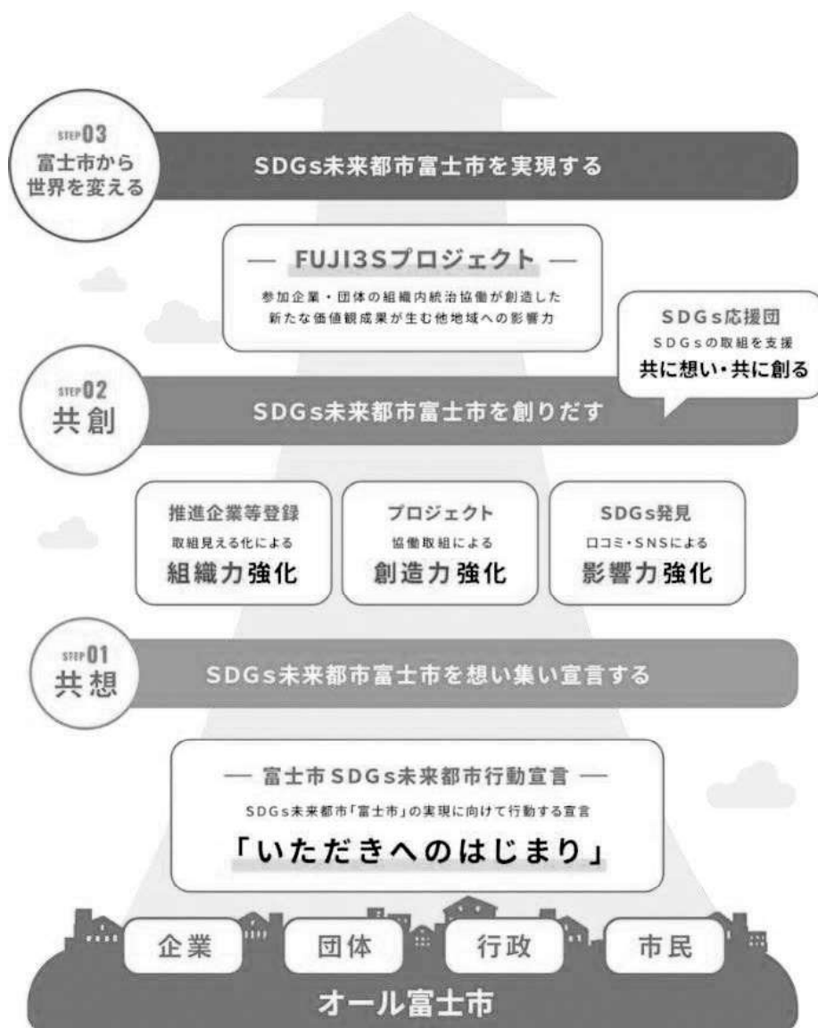
【富士市 SDGs共想・共創プラットフォームの構成図】

また、本計画の計画目標や個別の取組について、「SDGs共想・共創プラットフォーム」に行政課題として公表し、その解決に向けて、様々な企業や団体から広く提案を受け付けるとともに、官民連携によるプロジェクト創出拡大を図り、本計画に位置付けた取組の効果の拡大や加速化を図ります。