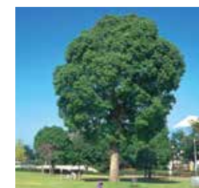
市民の木 Citizen's tree クスノキ camphor tree