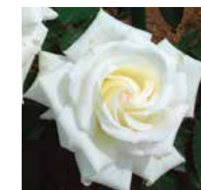
市民の花 Citizen's flower バラ rose