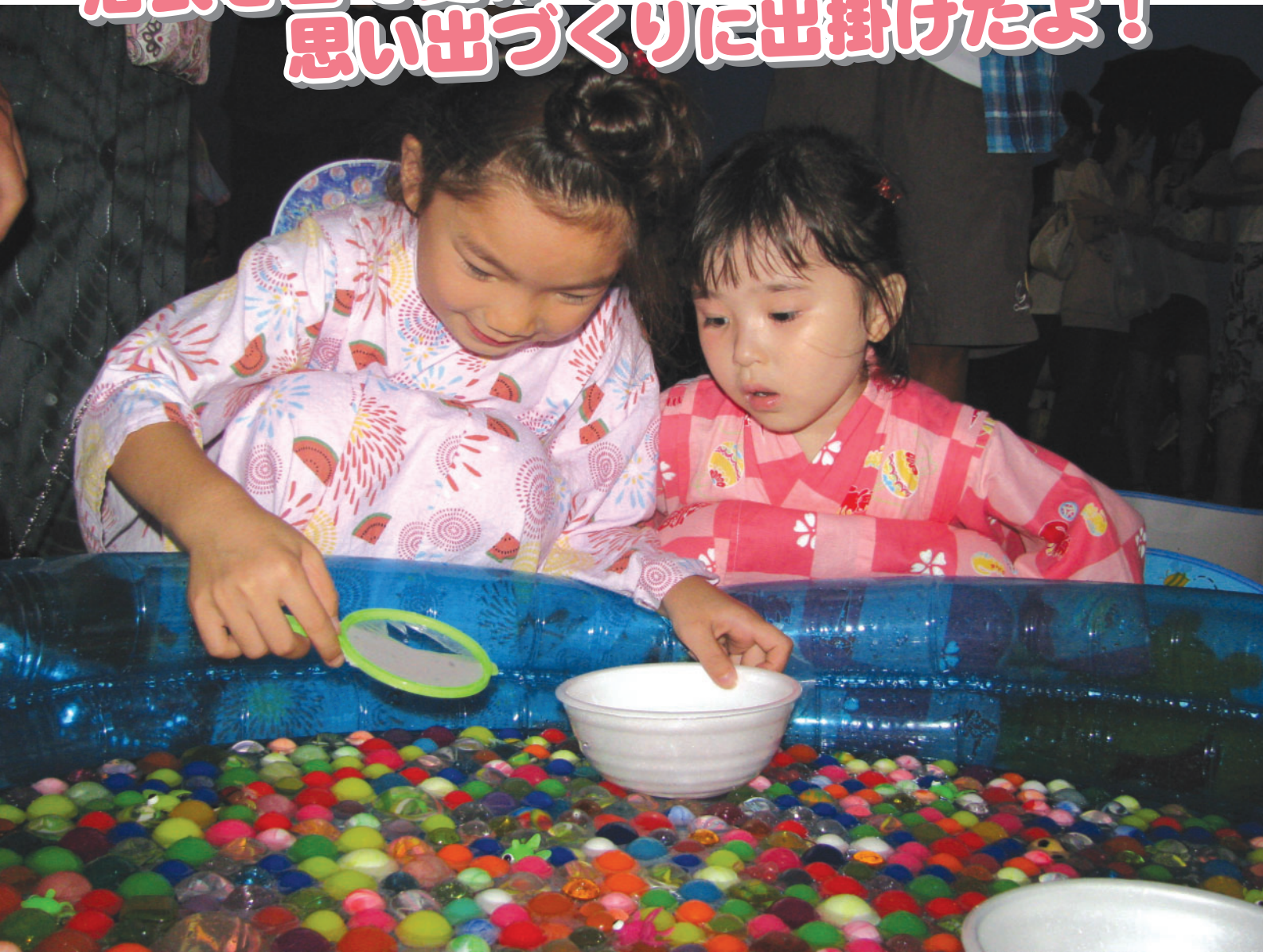
ふじかわ夏まつり (富士川河川敷スポーツ広場)