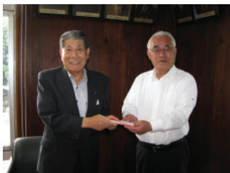
寄付金を いただきました

8月5日(火) 今年も(株)ホテ イフーズコーポレーションよ り、青少年健全育成のため に100万円の寄付金をいた だきました。寄付金は、教育 施設の備品購入等に有効 活用させていただきます。 ありがとうございました。