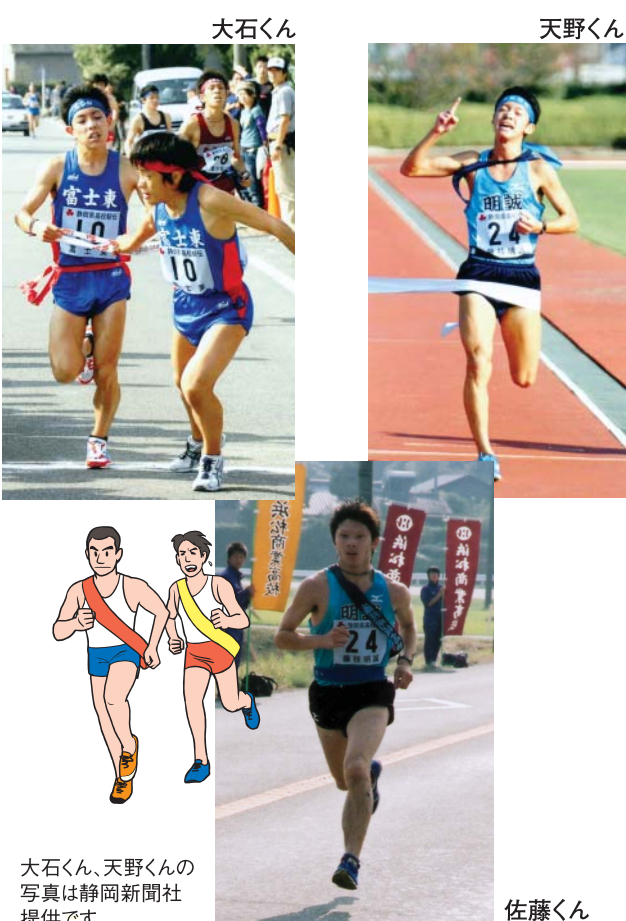
大石くん、天野くんの写真は静岡新聞社提供です。

また二区では富士東の大石港とくん(東町)が三年連続の区間賞を獲得するなど、今大会は、富士川町出身の高校生の活躍が光りました。