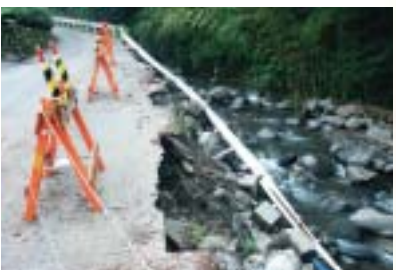
▲ 漆野橋手前の町道 (南松野)

当日は、朝から雨が降ったり止んだりのあいごへの天気でしたが、それでも子ども達はお祭りを楽しみに、境内へ足を運んでいました。来年は晴れま