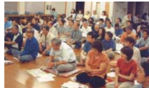
▲ 自主防災研修会の様子(中野台区)

町内には、救護所を二箇所(第一中学校保健室と第二中学校保健室)設け、軽症から重症患者までの応急処置を行います。応急処置を行うのは、地域の医師の方ですので、地域の医院を訪れても、医師がない場合もあります。 また、重症患者等の処置および収容を行う救護病院は、共立蒲原総合病院になります。