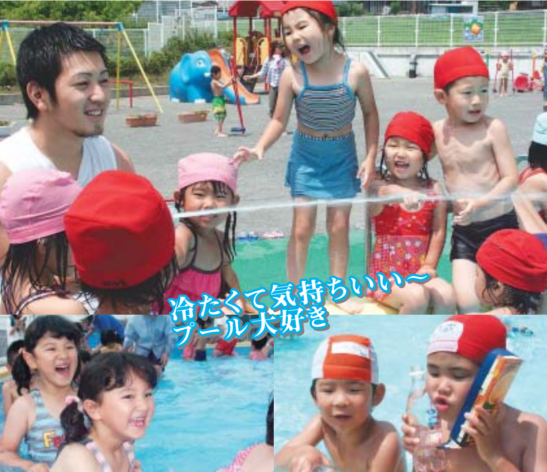
冷たくて気持ちいい〜 プール犬好き