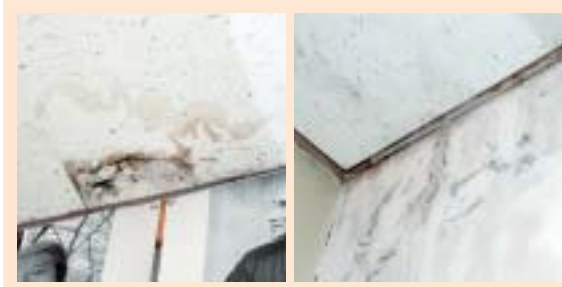
▲①屋上および北側・西側の壁からの雨漏り▲

第一小学校校舎は、昭和四十一年八月に総工費一億八百万円余りの巨費を投じて改築されました。以来三十余年の時が経過し、その間校舎は老朽化が進み、その都度緊急修繕で対応してきましたが、その経費は過去五年間で約一千五百万円を費やしています。しかし、老朽化は止まることなく経費は更にかさみ、今後修繕だけでは、おぼつかない状況が予想されます。