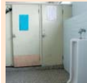
▲③トイレの汚水管の劣化による漏水