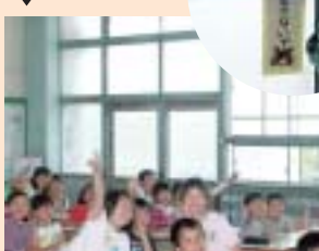
⑥サッシの錆による窓の開閉不能▶