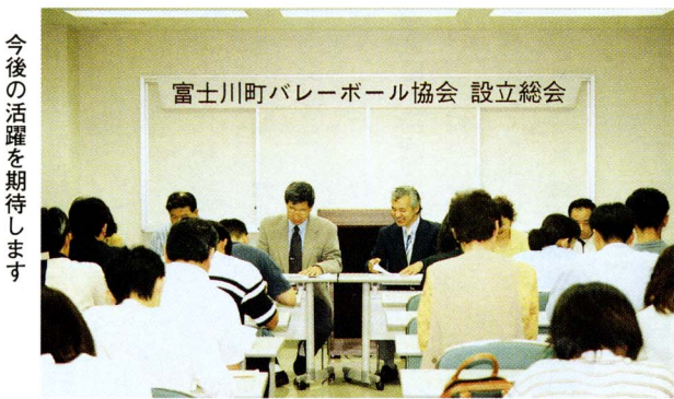
今後の活躍を期待します

当日は、シギ、メダイチドリ、セッカ、カルガモ、ハマシギ等四〇種ほどの鳥を見ることができました。富士川は、季節にもよりますが、三〇～四〇種の鳥が年間を通じて見ることが出来る場所です。非常に良い探鳥地となっています。