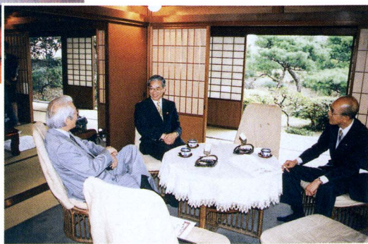
県知事を迎えて、古谿荘（現野間別荘）での語り