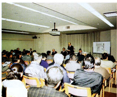
町民と本音で話し合う町政を語るつどい