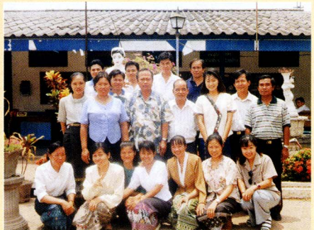
一緒に働いていた病院の仲間

二年半ぶりに帰国した時の東京は大変だった。普通に歩いているだけで人にぶつかってしまっし、横断歩道では相手もいないのに大声を張り上げている人を一瞬酔っ払いかと勘違いしたり、高校生の短いスカートに驚いたり、みな一様に茶髪にし、後ろで束ねた髪は、すれ違っても男か女か分からなかったりと、街を歩けば頭の中は、？とマークばかりだった。