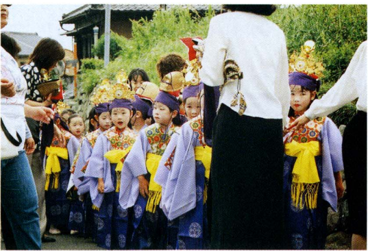
お化粧もして、可愛いですネ

花まつりは、お釈迦様が生まれた（旧暦四月八日）ことをお祝いするもので、灌仏会ともいいます。稚児行列は、さくら幼稚園の年長児四十一名がきらびやかな衣装を身にまとい、本通り三・四丁目公会堂から宗清寺前までを練り歩きました。