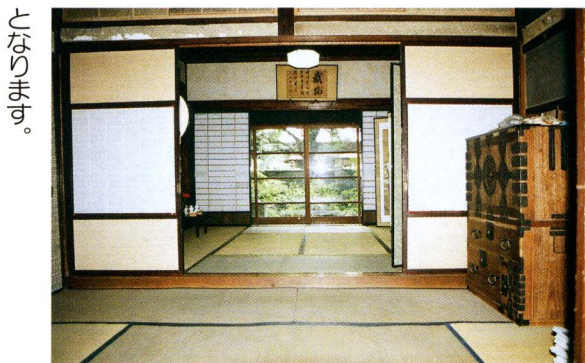
格式のある上段の間