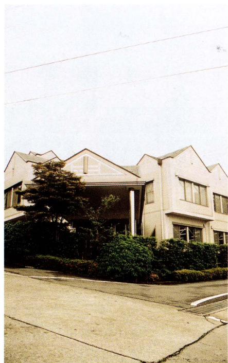
福祉サービスの拠点となる 地域福祉センター