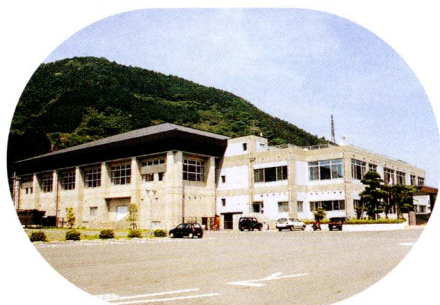
静岡国体でのバレーボール会場となりました総合体育館

この中で、特に印象的なものと言いますと、清水石炭火力であります。いろいろの評価はあるかと思いますが、富士川町の自然と環境を守ることが出来たという意味では、自分自身でもよくやったと思っています。中野台の団地造成については、用地取得に大変苦労いたしました。その後の町の人口増と活性化を考えますと、苦勞