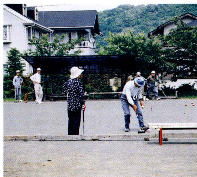
明るい老後は健康から

一九九七年に発表された日本人の平均寿命は、男性七七歳（平均余命九年）、女性八三歳（平均余命八年）です。これからは、かなりの人たちが七五歳から八五歳前後まで生き、そしてその半数の人が要介護状態となると予想されています。そうしたことから「介護」という問題に多くの人たちが直面することとなります。 総理府が行った老後生活に関するアンケート調査でも、「自分や配偶者の身体が虚弱になり、病気がちになること」、「自分や配偶者が寝たきりや痴呆性老人になり介護が必要となったときのこと」を高齢期の最大不安要因として挙げる方が半数を占めています。