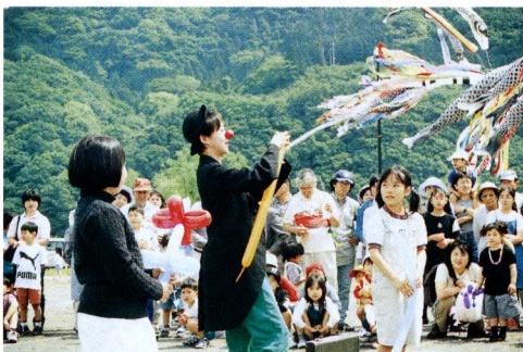
子どもたちの笑顔が一杯ありました

富士川こどもまつり（同まつり実行委員会主催）が、五月五日のこの日に、木島地先の富士川河川敷で行われ、多くの子どもたちや家族連れでにぎわいました。会場には、百匹ほどの鯉のぼりが揚げられ、「お水のペットボトルづめ」や「フィルムケースふた飛ばし」などのチャレンジランキング、飛行機づくり、紙芝居、ピエロなどによる大道芸が行われま