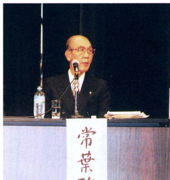
シンポジウムのパネラーとして

最後になりましたが、新しく町長となられる方におかれましては、町民のみなさんご意見を汲み取りながら、議会と協力して、二十一世紀の富士川町の更なる発展と飛躍に努めていただくことを、切に願います。