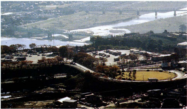
町の活性化を目指して、地域拠点整備事業進む

私が実施した事業には、野田山健康緑地公園や総合体育館、中央公民館など多くのものがあります。この中で印象に残っているものはなにか、ということになりますと、数多くある中から3つあげ