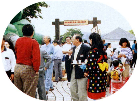
茶娘による、お茶のサービスが行われました

開通当時の富士川静岡間の料金は、普通自動車が三〇〇円、大型バスは九〇〇円でした。現在の料