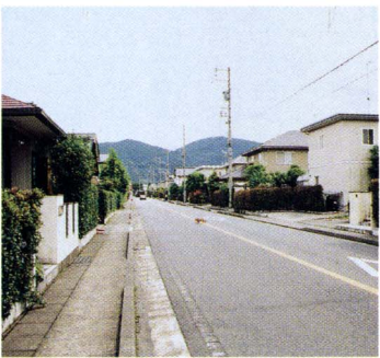
整然と建ち並ぶ中野台

祉面の向上がかなり図られたと思っております。また、施設整備の面でも、医療関係者から高い評価をいただいておりますので、二十一世紀に向けた医療体制が整備できたのではないかと考えています。しかしながら、みなさんから要望が多い、駐車場の問題については未解決となっておりますし、また老人保健施設についても、三町の財政事情が厳しいこともあって、三