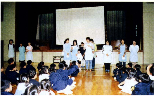
交通安全の大切さを訴えました（みなみ母親クラブ）

母親クラブは、児童館を拠点として活動する、お母さんたちの自主活動組織です。児童館まつりなどで、母親クラブの行う人形劇を見たことがあるかと思いますが、子どもたちのための奉仕活動や様々な研修活動等を行っています。入会も随時受け付けています。