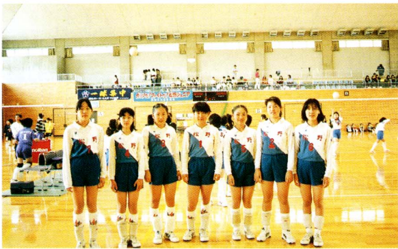
これからもガンバリます！

当日は、各予選ブロック1・2位によるトーナメントにより試合が行われ、Aトーナメント（予選