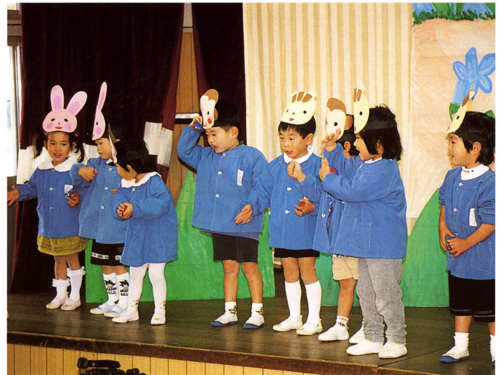
◆松千代保育園で生活発表会 十二月十四日、松千代保育園で生活発表会が行われ、父兄のみなさんは、子どもの成長を喜びました。園児たちの歌や演技に会場は、なごやかな笑いにつまれました。