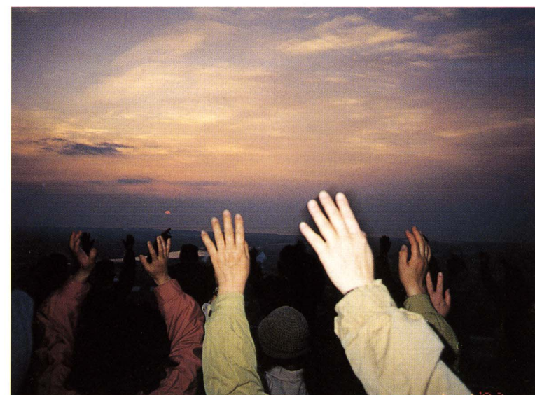
平成9年の初日の出です

まちの新年初行事は、元旦ジョギングの集いです。 今年も、富士川地区百二十人が第一小学校から川坂山へ、また、松野地区五十人が松千代保育園から農免農道へ元気にジョギングし、御来光を迎えました。 今年の御来光は、ご覧のように、薄い雲がじゃまをしており、残念でしたが、参加者全員で万歳をし、お互いに一年の始まりを祝いました。