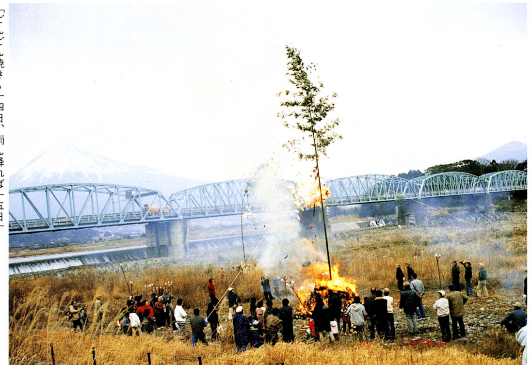
「どんどん焼き」十四日、雨ん降れば十五日「一月十四日に行われた、上町区のどんどん焼き」