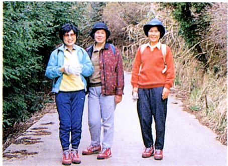
自然を満喫しています

蒲原町の御殿山から登ってきました。野田山については地元の新聞で紹介されているのを見て知りました。こんなに景色が良くて、自然に恵まれているのだから積極的にPRしていったらいいかな。また、野田山の由来、植物