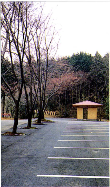
「はたご池」が新しくなった!