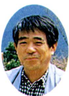
(金柿さん) 富士松野

最後に、ここは私たち富士川町の誇れる貴重な財産のひとつです。この広場にはゴミ箱はありません。ゴミは必ず持ち帰り、いつまでもきれいで気持ちよく、使っていきたいですね。