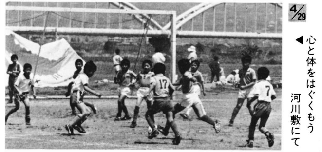
4/29 心と体をはぐくもう 河川敷にて