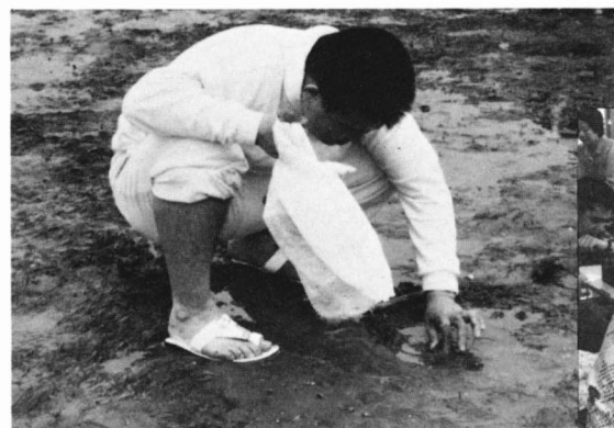
初めての潮干狩りも体験しました

家にいる時は、どうしても暗くながちですが、ここに来ると、所生のみなさんが明るく、気が紛れます。また、潮干狩りやバーベキューなどの行事もあり、みんなで楽しく過ごせる時間が、とても嬉しい。今では、この作業所が自分の家のように思え、仕事があまくいくと、気持ちがいっぱりします。これからも、みなさんと気を合せて、がんばります。