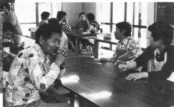
休み時間は、話はずみずみ

玄関を入ると「いいです」と、所生の元気な掛声が聞こえ、みんなで協力して、作業が進みます。仕事をしている時は無中になり、表情も真剣ですが、休み時間とお昼のご飯を食べる時は、緊張感も和らぎ、みんなが楽しみにしている時間です。指導員さんをお迎え、楽しいおしゃべりに花が咲いたり、テープに合わせて歌を歌ったりして、交流を深め、次の仕事への気分転換にもなっています。