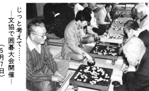
じつと考えて…… 文協で囲碁大会開催 (5月7日)