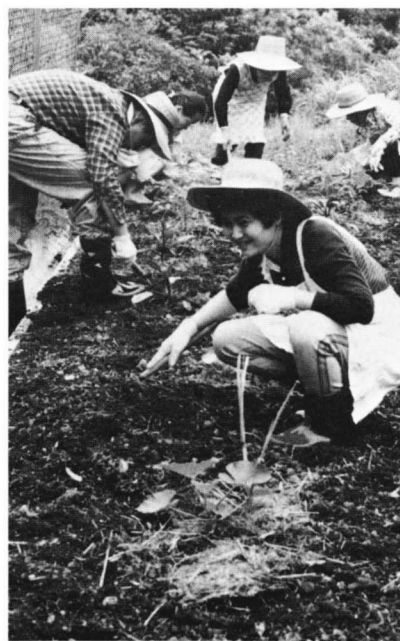
たくさん収穫を期待して……

作業所のまわりの農園には、ナス・トマト・カボチャなどが植えられ、トマトには白い花が咲き、カボチャのつるも元気よく伸びています。所生のみなさんは野菜を育てる喜びと、収穫して自分たちで調理して食べることを夢見て、汗まみれで体を動かします。シャベルを動かしているみんなの目が、生き生きと輝いているのが印象的でした。