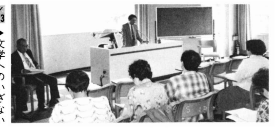
5/13 文学へのいざない 文学講座開講