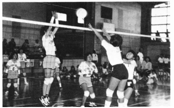
5/7 一人一スポーツをめざせ 子供会バレーボール大会