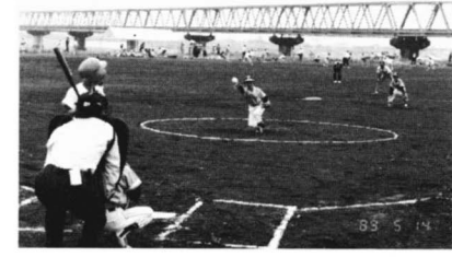
5/7 チームワークで 勝利をめざせ 子供会球技大会