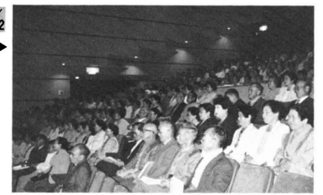
4/12 まきの木大学開講 いつまでも学ぶ心を忘れずに