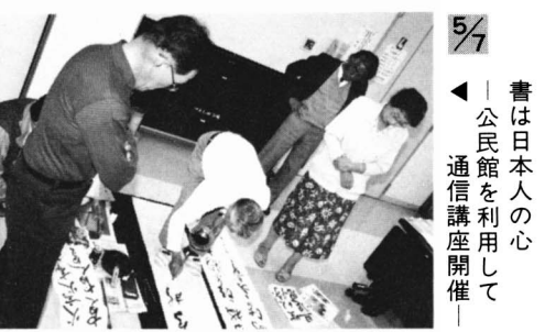
5/7 書は日本人の心 公民館を利用して 通信講座開催