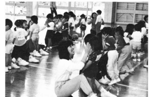
4/18 のびのび育てよ 親子スポーツ教室