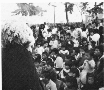
人形劇は子どもたちに大人気