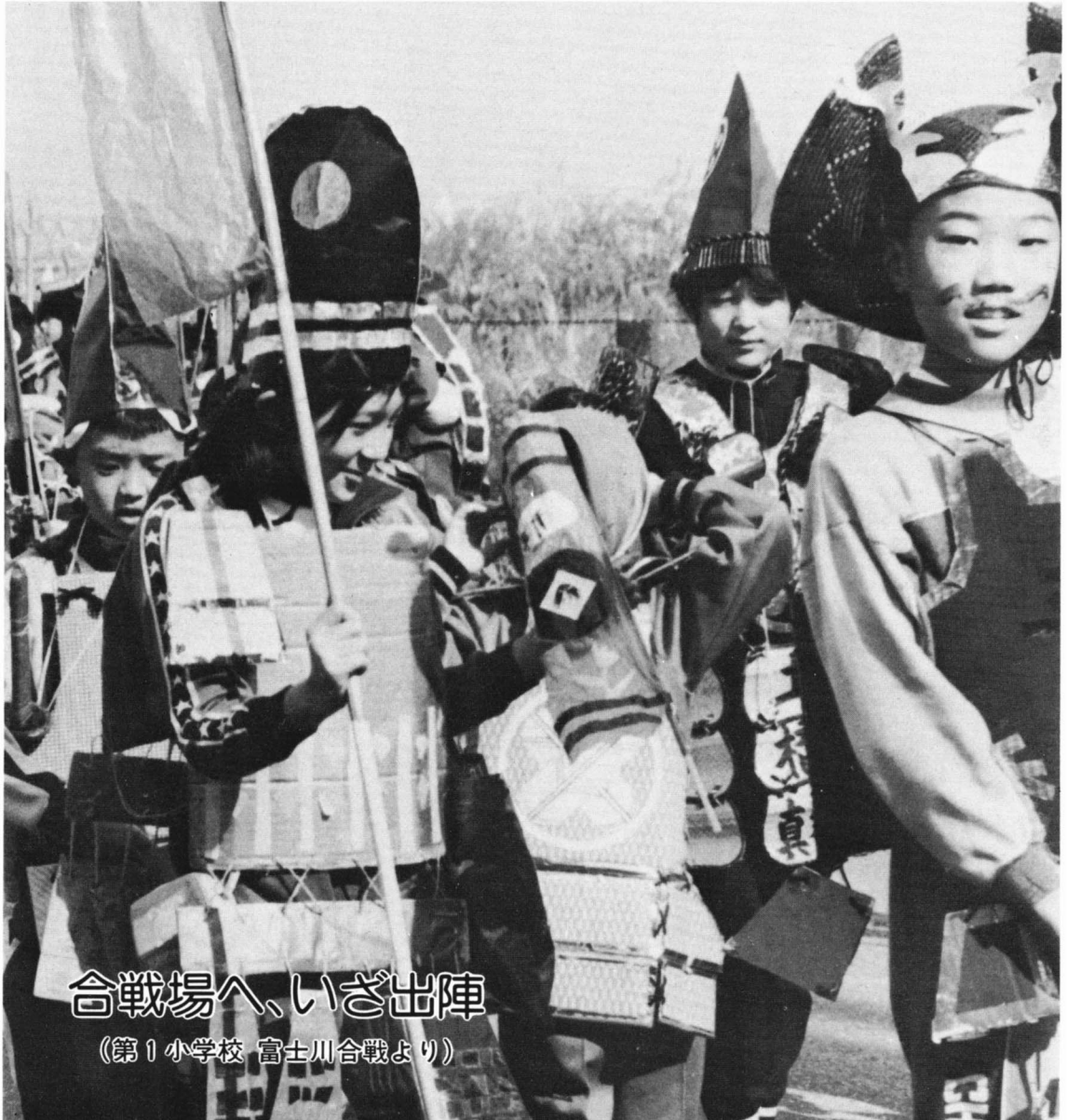
合戦場へ、いざ出陣 (第1小学校 富士川合戦より)