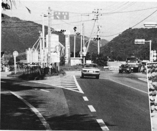
交通安全塔の立つ木島交差点