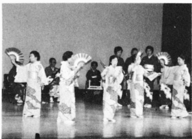
芸能大会も見どころがたくさん