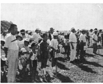
楽しい区民大会がスタート

絶好のスポーツ日和に恵まれた8月30日、スポーツとレクリエーションを通して、区民の親睦をはかる――と、木島河川敷広場で木島地区(木島・小山・室野)の第