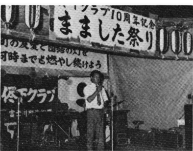
記念式典も盛大に

して、区民手づくりの「修下祭り」を行いました。同クラブは昭和47年に発足、現在クラブ員五十四人を有し、各種スポーツ大会から清掃奉仕までと、幅広い活動をしています。25日、お祭り広場である秀村医院の駐車場を訪ねると、広場には、かき氷・焼ソバ・金魚すくいなどのお店が並び、中央の舞台では同区のみなさんによる民謡・踊り・子どもノド自慢などが行われ、黒山の人でにぎわっていました。このお祭りを取材して、同区のみなさんは、どんな催しを行うにも、家族ぐるみで参加するということに、私はとても感心しました。 松尾保子