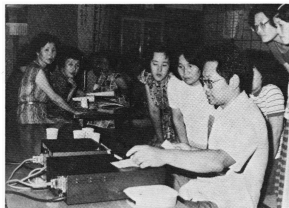
私は健康体かしら

町では、日ごろ家事や育児に追われて健康診断など受ける機会の少ない婦人のみなさんを対象に、6月5日の木島公会堂を皮切りに7月23日の相生町公会堂まで十七日間、二十会場で「尿検査・血圧測定」を行いました。これは町が進めている成人病予防対策の一つとして、婦人会のみなさんの協力を得て行ったもので、この間に検査を受けた人は約六百人にものぼりました。 このほど環境衛生課で、今回行った検査の集計結果がまとまりましたので、みなさんに紹介することにします。 尿検査では 約六百人のうち二百十三人が異常 みなさんは、健康人が一日にどれくらいの尿を排せつするか知っていますか？健康人は一日に約一渺の尿を排せつするといわれま ニア・ナトリウム他）が含まれています。それらの物質量が多いか少ないか、また有るか無いかを調べ、私たちの体の状態が健康か病気の疑いがあるかを判断することが、尿検査でできます。 このため町では、みなさんの健康管理に役立てようと、尿分析器を購入しました。同器機は、高性能のマイクコンピュータが内蔵されており、尿に浸した検査用紙を入れるだけで、PH・タンパク質・ブドウ糖・ケトン体・ビリルビン・潜血・細菌・ウロビリノーゲン