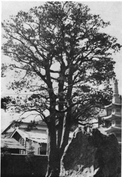
松本山慈林寺（新町）の旗

何百年も生き抜いてきた古木、風雪に耐えてきた古木を見上げると、なぜか、心に安らぎをおぼえるものです。そこに心の故郷があり、ずっしりと歴史の重みを感じられるからでしょうか。 そこで教育委員会では、文化財審議会（芦川守正委員長）の意見をきいた上で、それらの古木のうち、特に推奨したいものを選んで3月中に、広く町民のみなさんにお知らせするよう準備中です。 また、樹種や樹齢、太さ、高さなどとともに、その木に伝わる伝承なども紹介していきます。 寺社の境内や道端で、大きなネットレスをかけた古木に、みなさんが出逢うのは、4月頃になりますが、お急ぎでない方は、ぜひ、町の古木を、ゆっくり見上げてやってください。