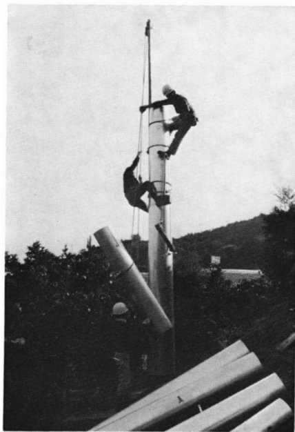
四十九町受信局の新設工事

「東海沖大地震」発生説が各専門学者により論じられていることは、みなさんも知っているでしょう。いつ起るか分らない大地震やその他の災害時の情報伝達網を充実させようと町では、毎年、広報無線受信局を増設し、52年度までに24カ所に設置しました。 53年度は、先に完成している日の出町・立清水・北松野口和受信局に加え、2月5日から四十九町・鍵穴・南松野根方・矢所・三十坂北松野富士松野受信局新設工事が 2月下旬完成を目指して着工されました。広報無線受信局は、高さ10～15mのパンザーマスト（鉄柱）に受信装置、スピーカーを備えたもので可聴範囲は300～500m、マグニチュード7の地震や、風速60以上の強風にも耐えられます。 なお、町では54年度で町内全域の情報伝達網を完全なものにする予定です。 55年度以降の検討課題としては、現在の受信局は電線が切断されれば使用不能となると、各カ所から、非常電源装置の取り付けや各地区別に情報伝達のできる選局装置の取り付け、現在のように役場からだけの一方的な情報伝達だけでなく、各受信局から役場への情報伝達のできる装置を取り付けるなどがあります。