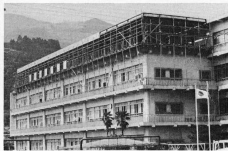
増築中の第一小学校

れを解消するため、普通教室を六室、教材室を一室増築することになりました。面積は五二〇㎡で、総工費六千万円を費し、昭和51年11月30日に完成する予定です。