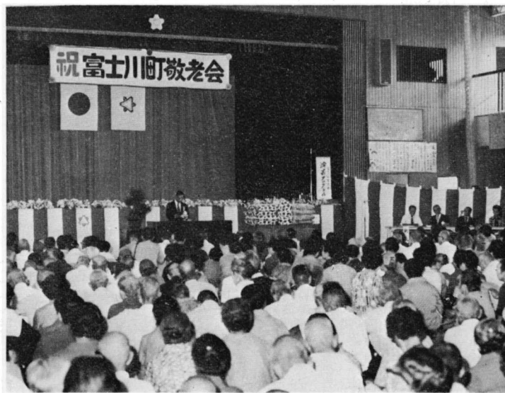
敬老会で挨拶する高岡町長