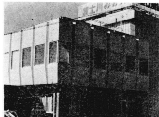
新しい農協の事務所完成

鉄筋コンクリート二階建て(一部三階)の新しい事務所は、延べ六百五十八平方メートルの近代的な建物です。