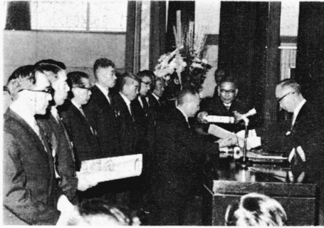
中川町長から表彰状を受ける功勞者

新庁舎は、鉄筋コンクリート三階建て、延べ千八百九十九平方メートル（五百五十一坪）それに鉄筋コンクリート二階建て、延べ二百三十三平方メートル（六十五坪）の消防庁舎が併設されていて総工費一億五千万円をかけた近代的な建て物です。改築工事は、昨年二月から旧庁舎跡地に着手し、十二月十五日完