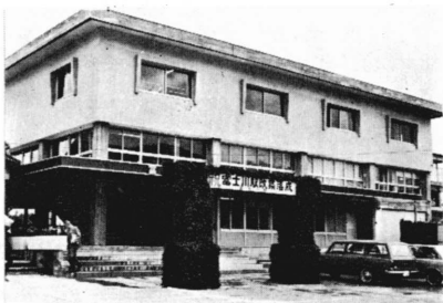
写真 新装なった富士川駅

新駅舎は、駅本屋が鉄筋コンクリート3階建、延六四三㎡。東口通路橋は、鉄骨造り長さ六六m、幅3m。工費七千二百万円。停車列車数、上り下り客車32本