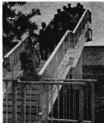
写真 町長、議長を先頭に渡り初め