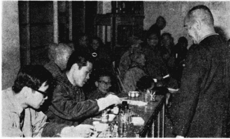
写真 健康診査風景、東町公会堂

町内各事業所の寄金をもとに、富士川町を紹介する16ミリカラー30分もの映画「ふじかわ」が完成、近々皆さんに公開されます。