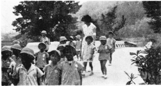
写真 新装、地蔵橋。園児も嬉しそう。

北松野有無瀬橋の上流、清水と道上を結ぶ旧地蔵橋は、重なる有無瀬川の災害で、補修もさかなくなりましたので清水土地改身事務所に請願、県単独補助事業として事業費の承認を受け、昭和四十三年二月、新地蔵橋建設に着工、七