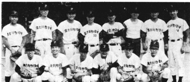
写真 試合に敗れたある日の富士川町役場野球部員