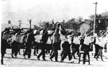
写真 熱戦の婦人順送球