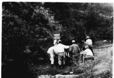
写真 鳥獣保護区の標識を立てる 猟友会の人たち。 手分けして二十ヶ所に設置

中之郷町の尼寺から蒲原町の日本軽金属株式会社総合研究所一帯の丘陵(36ヘクタール)が「大栗窪鳥獣保護区」に設定されました。