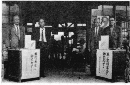
▼さあ 募金開始ノ勢揃いした会員

たすけ合いの行動とはお金だけを寄附することではありません。わたしにもきみにもできるたすけあい。子どもの一円募金からお年寄りまでこの運動に参加するこ