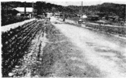
※道路建設は…… 写真は県道富士川沿線