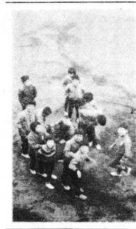
※福祉、衛生施策は…… 写真は町民の集まり