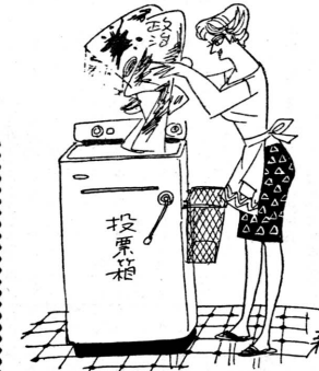
一票でママは政治のお洗濯

5月28日、町内の本相製紙岩淵工場体育館で結団式が行われた。このボーイスカウト富士川町第一団は、中之郷地区の小学校5年生から中学校3年生までの16人で組織されている。