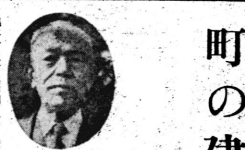
池谷町長は昭和三十九年頭にあたり次のような談話を発表した。