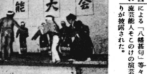
富士川町文化祭の盛況。