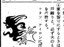
秋の火災予防運動のポスター。

秋の火災予防運動が全国一斉に実施される。富士川町では、11月26日から12月2日まで実施される。